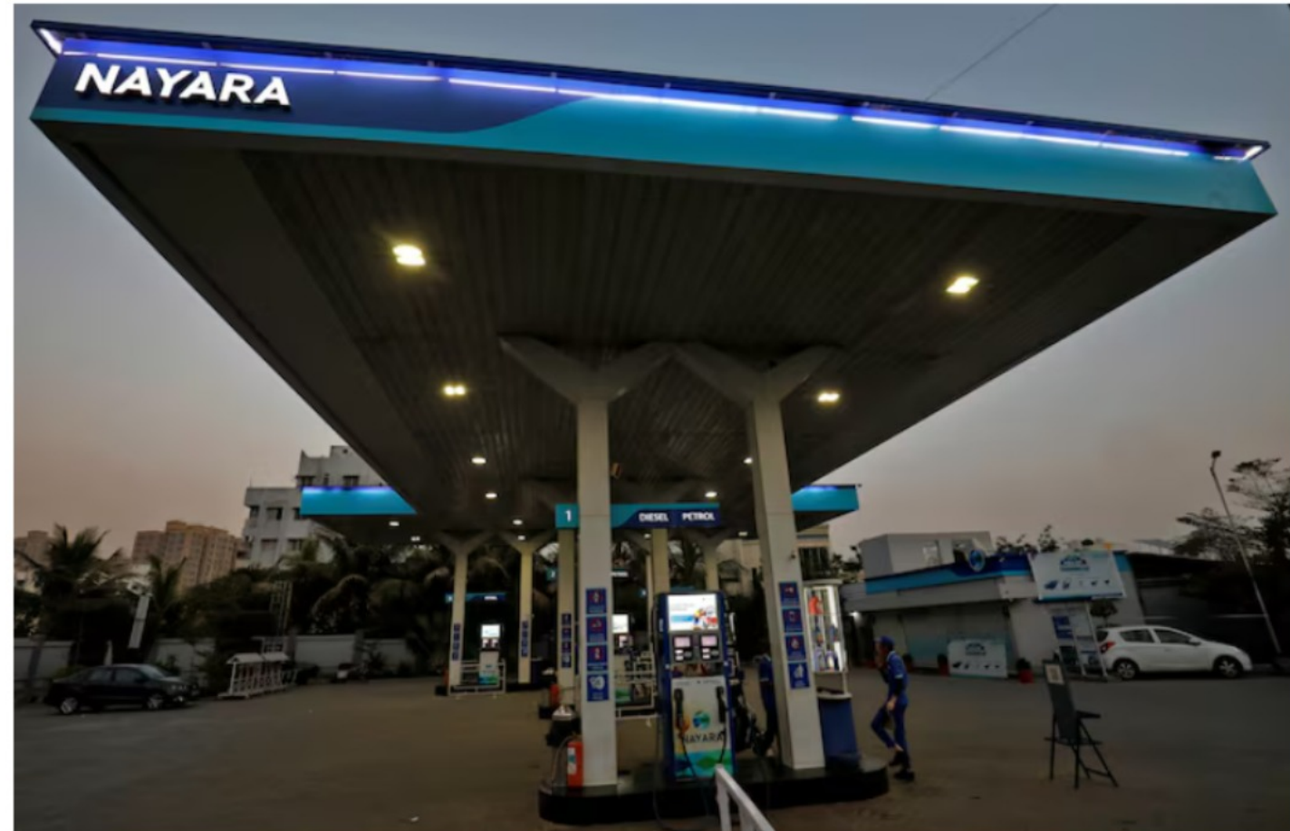
A worker stands at a fuel station of Nayara Energy on the outskirts of Ahmedabad, India, November 16, 2022.