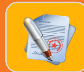
Processo de Contratação