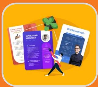
Divulgação de Vagas