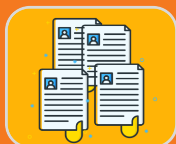
Recepção de Candidaturas